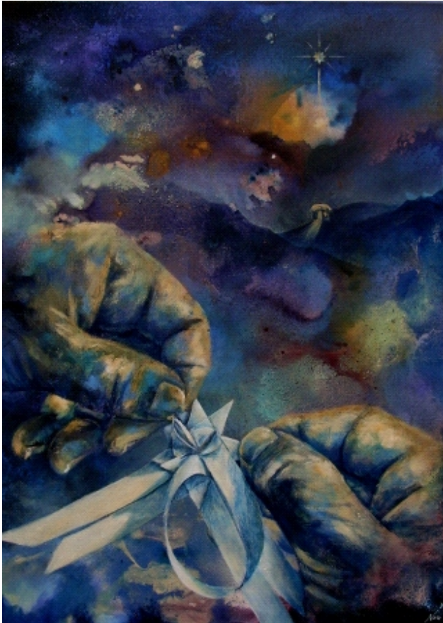
Tidens fylde, Helle Noer (se side 2 og 3)